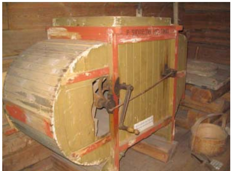
Viskurilla poistettiin roskat viljan joukosta.